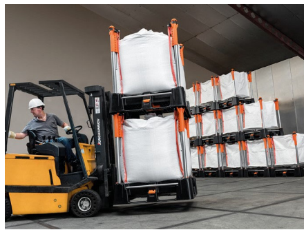
安全な内部及び外部輸送