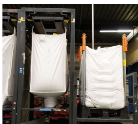
既存工程にスムーズな導入