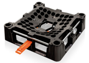
スライド部が開いた底面部