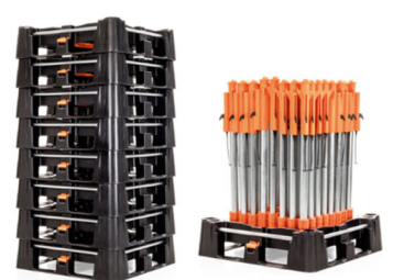
未使用時は最小限の容積