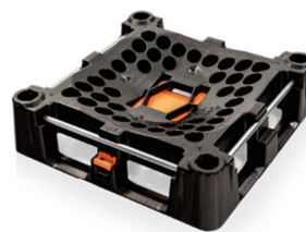
スライド部が閉じた底面部