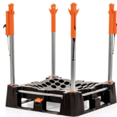
システムの完成形